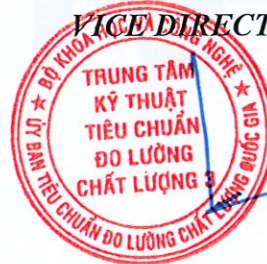
Phan Thành Trung

1. Các kết quả thử nghiệm ghi trong phiếu này chỉ có giá trị đối với mẫu do khách hàng gửi đến và không phải là giấy chứng nhận sản phẩm.